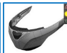
Voir toutes réf page suivante – see all item codes next page