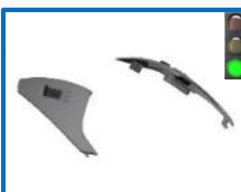
Voir toutes réf page suivante – see all item codes next page