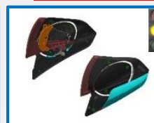
FX9464P – FX9469P