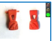
JU1000P - JU1100P