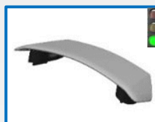
VE9480P – VE9482P – VE9485P