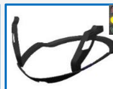
JO9420P – JO9425P