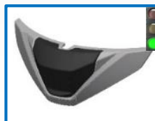
Voir toutes réf page suivante – see all item codes next page